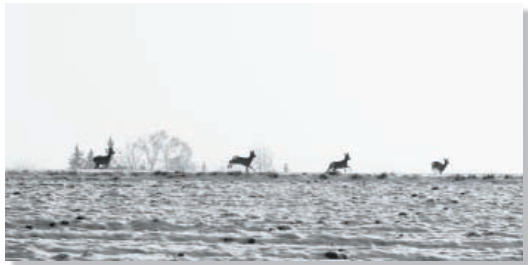
Gerd Engl - Auf und davon Annahme