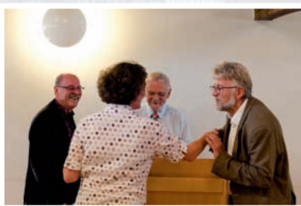
Eröffnung der Bezirksfotoschau 2011 in Schwabach