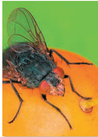
Gregor Nowok - Fliege Annahme