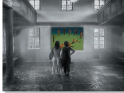
Helmut Lodes - Das Gemälde Annahme