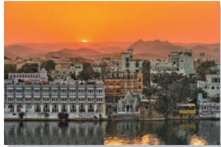
Gregor Nowok - Lake Pichola Urkunde