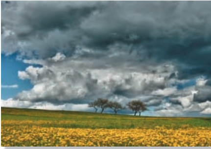
Helmut Lodes - Gewitterwolken im Frühling - Annahme