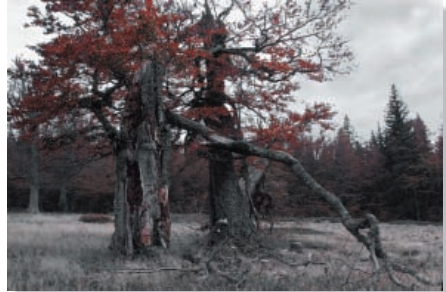
Wolfgang Bahl – Baumgestalten Annahme